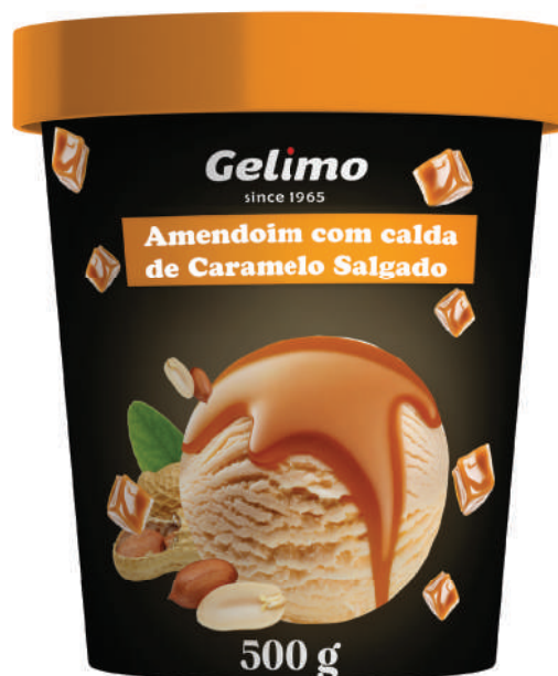
SORVETE GE'LIMO DE AMENDOIM COM CALDA DE CARAMELO SALGADO