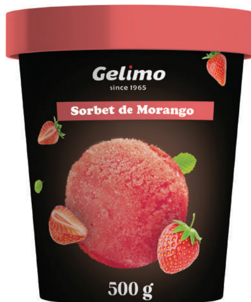
SORBET DE MORANGO