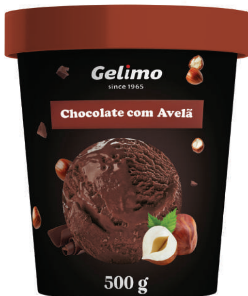
SORVETE GE'LIMO DE CHOCOLATE COM AVELÃ