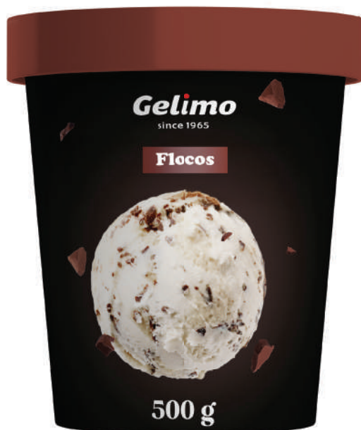
SORVETE DE FLOCOS